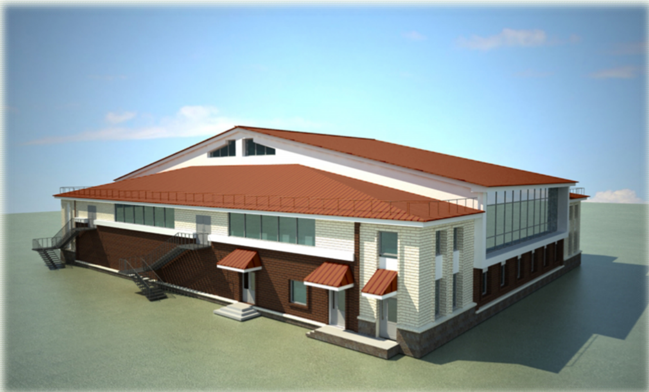
Столовая на 380 человек

Адрес: г. Санкт-Петербург, Лагерное ш., дом 57